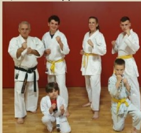
Section Karaté 2023/2024

Ce grand amateur de karaté pratique depuis près de 40 ans maintenant « j'ai commencé en 4e ou 3e, c'est une passion de gamin ». Il enseigne à une dizaine d'adhérents, mais en appelle à de nouveaux adeptes pour partager cet art martial.